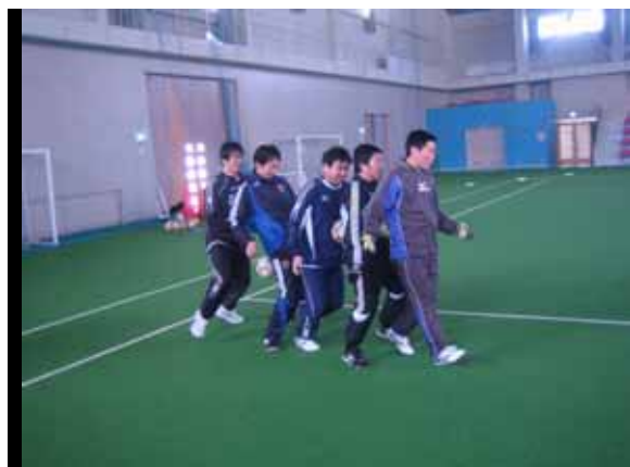
アイスブレイク紹介 「ボールトローリー」