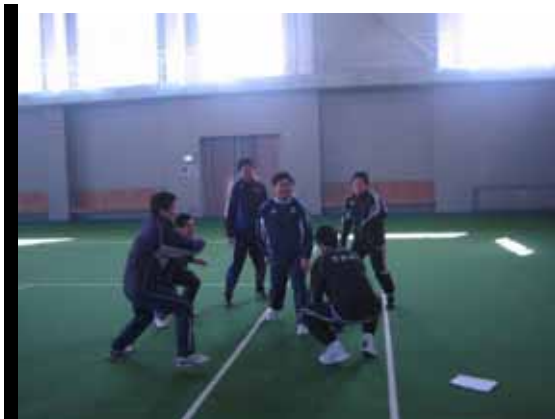
アイスブレイク紹介 「ジップ、ザップ」