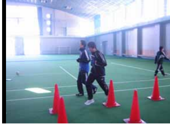
コーディネーション紹介 「並走者のスピードに合わせて、コーン間ジグザグ走」