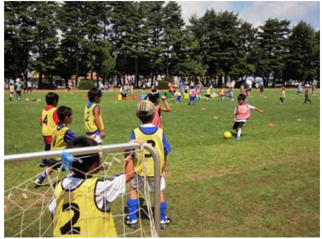
ここから【2年生 試合のようす】