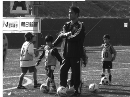
小倉 隆史コーチ 元サッカー日本代表