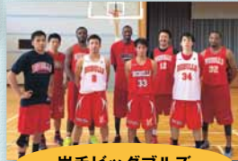
岩手ビッグブルズ