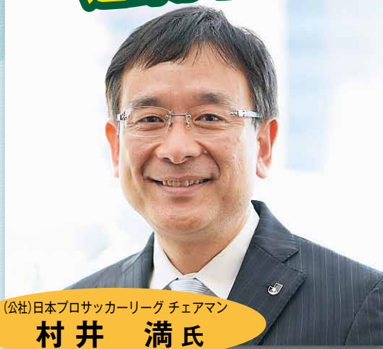
(公社)日本プロサッカーリーグ チェアマン