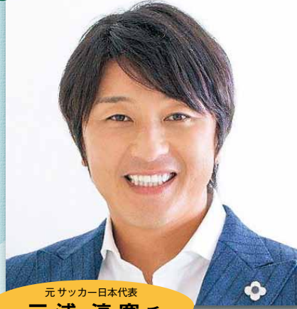
元サッカー日本代表 三浦 淳寛氏

昭和34年生。埼玉県川越市出身。早稲田大学法学部卒業。昭和58年(株)日本リクルートセンター入社後、(株)リクルートエイブリック代表取締役社長、RGF Hong Kong Limited取締役社長を歴任。平成20年(社)日本プロサッカーリーグ理事、平成26年1月(公社)日本プロサッカーリーグチェアマン、同4月(公財)日本サッカー協会副会長。