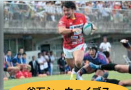
釜石シーウェイブス