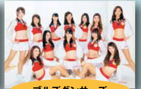
ブルズダンサーズ