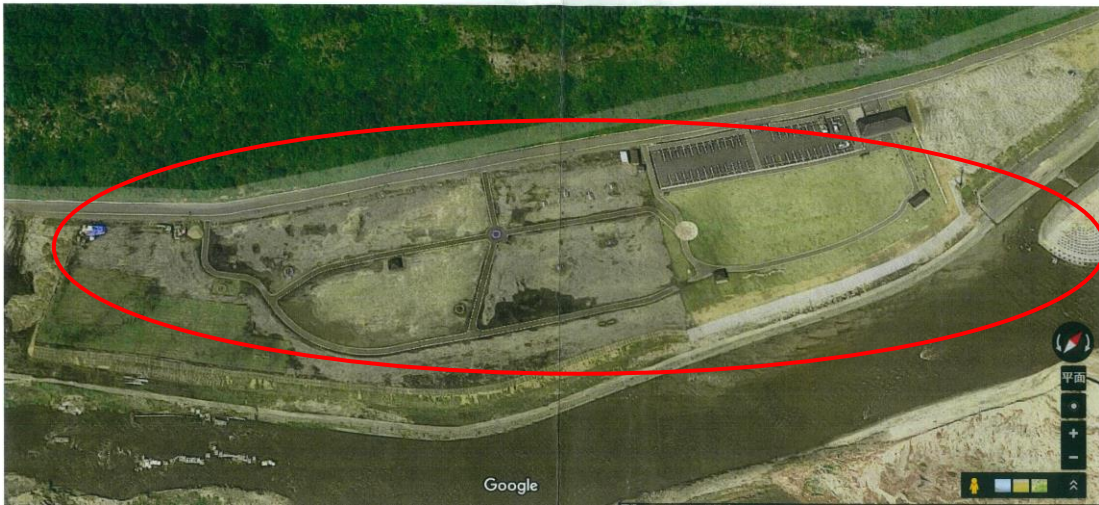
普代浜 B&G 海洋センター体育館